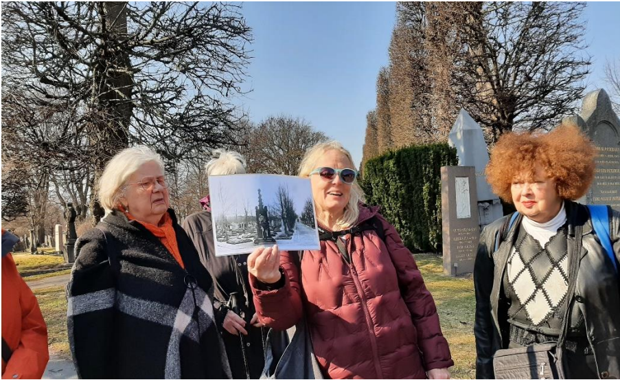
Här syns August Blanchers pampiga gravvård på en tidig bild.