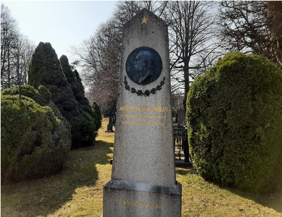
Vid denna den ursprungliga entrén finns också skulptören Johan Peter Molins (1814 – 1873) gravsten.

Molin är kanske mest känd för sin Kungsträdgårdsfontän, vars ursprungliga version gjordes till Stockholmsutställningen 1866.