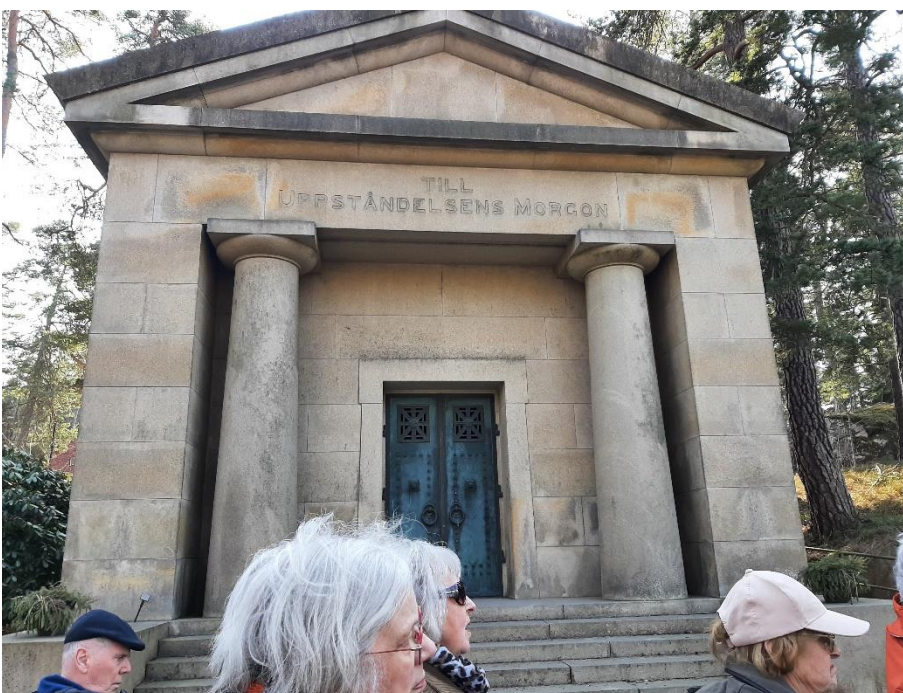
En del personers och familjers gravkammare är enorma och avsedda att inge respekt och kanske avund hos samtiden.

Molin är kanske mest känd för sin Kungsträdgårdsfontän, vars ursprungliga version gjordes till Stockholmsutställningen 1866.