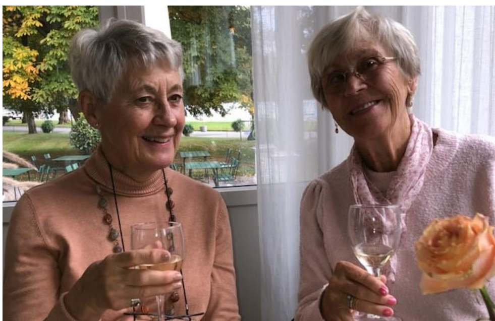
Text och bilder: Margaretha Östling