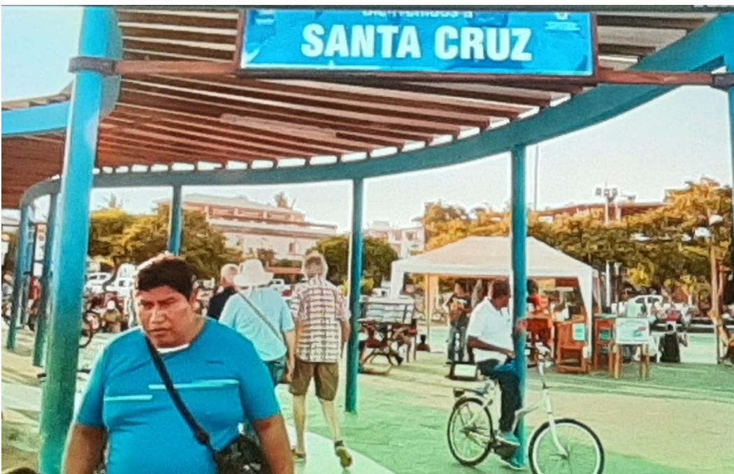
Det sista strandhugget var på ön Santa Cruz.