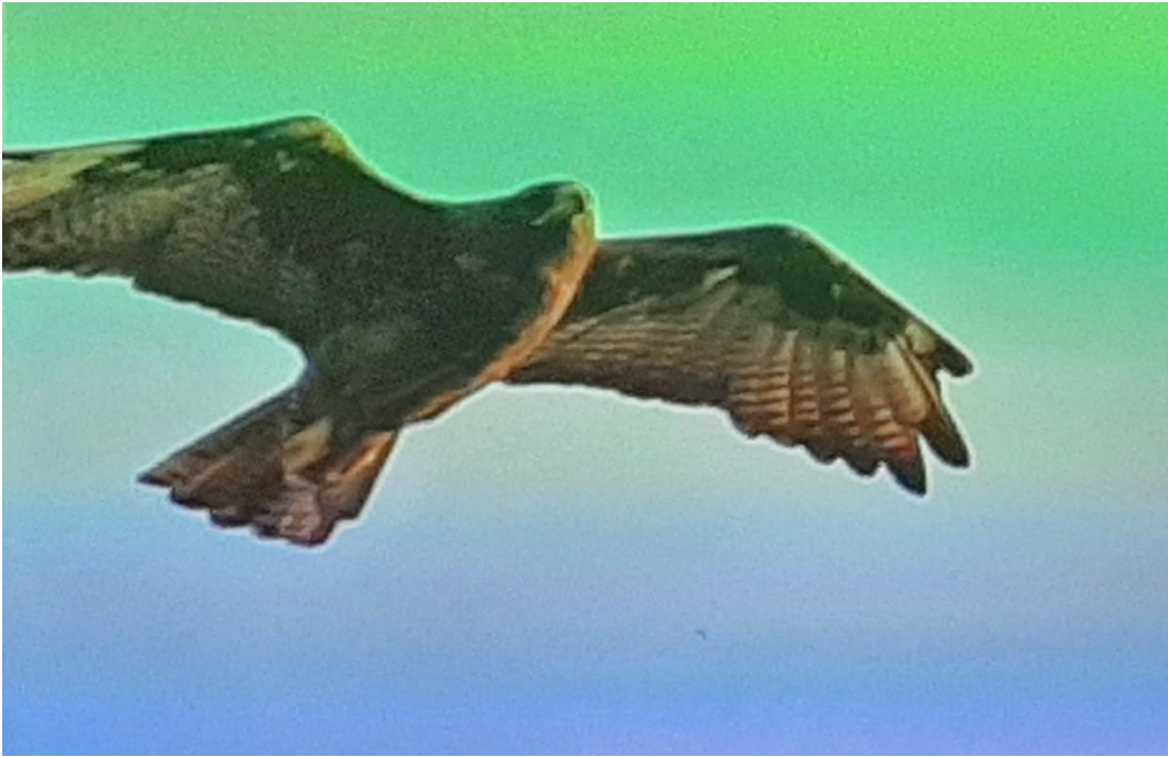
Galapagosvråken är en av få rovfåglar på öarna.