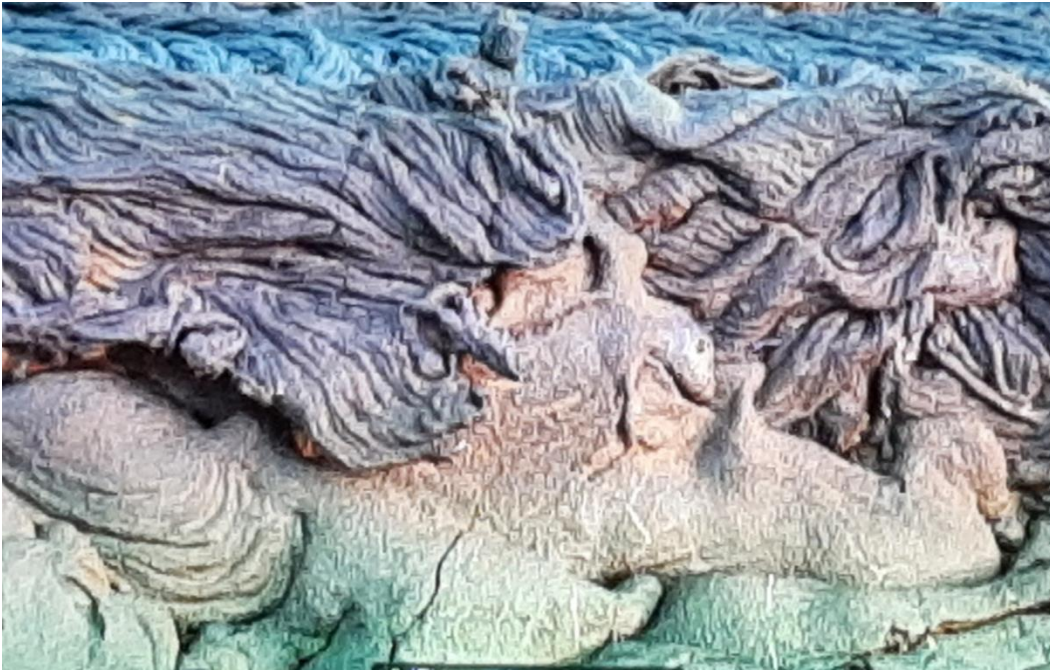
Galapagosöarna är vulkanöar och på några platser har lavaströmmar skapat märkliga formationer.