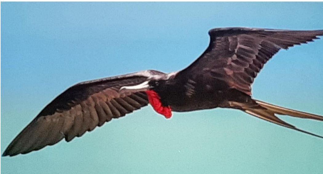
Praktfregattfågeln gör verkligen skäl för sitt namn.

Den har en enorm vingbredd och kan hålla sig svävande mycket länge.