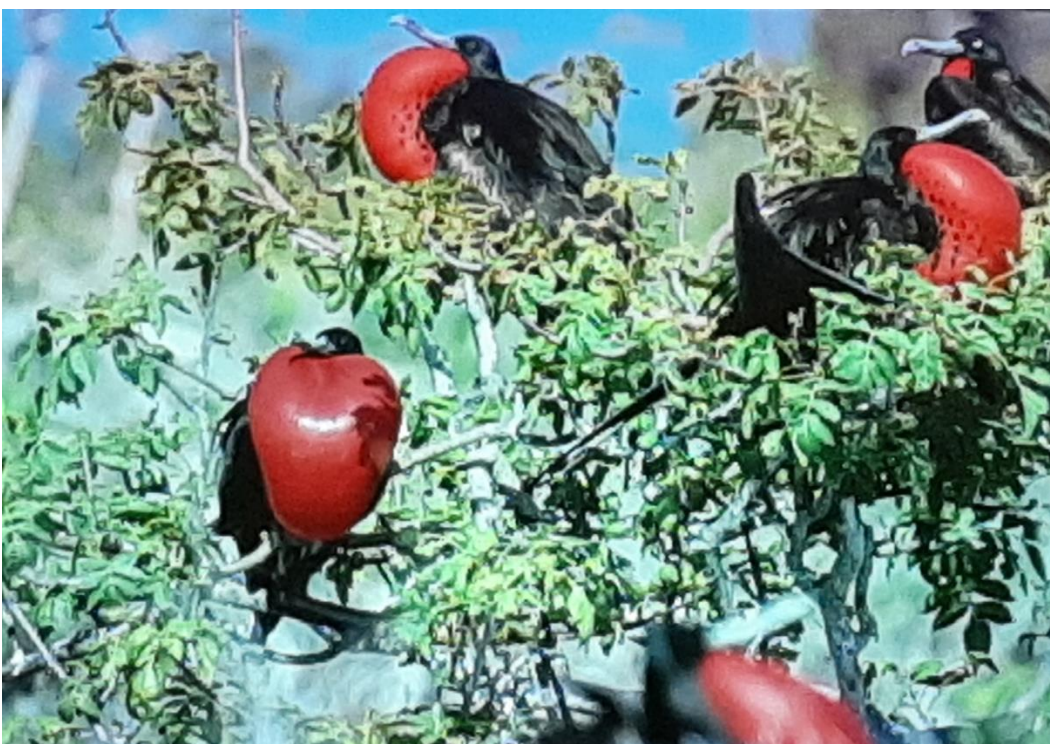
När det är dags för parning blir den extra praktfull.

Den har en enorm vingbredd och kan hålla sig svävande mycket länge.