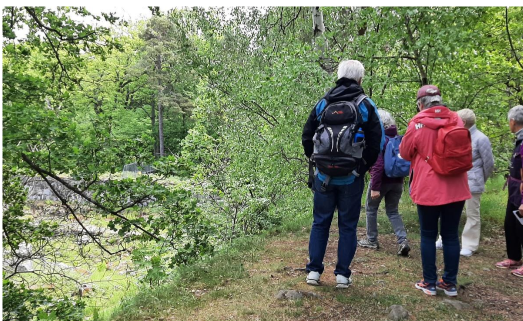
Här står vi ovanför Haga slottsgrund eller Stora Haga slottsruin, som är resterna av Gustav III:s storslagna plan för Stora Haga slott.