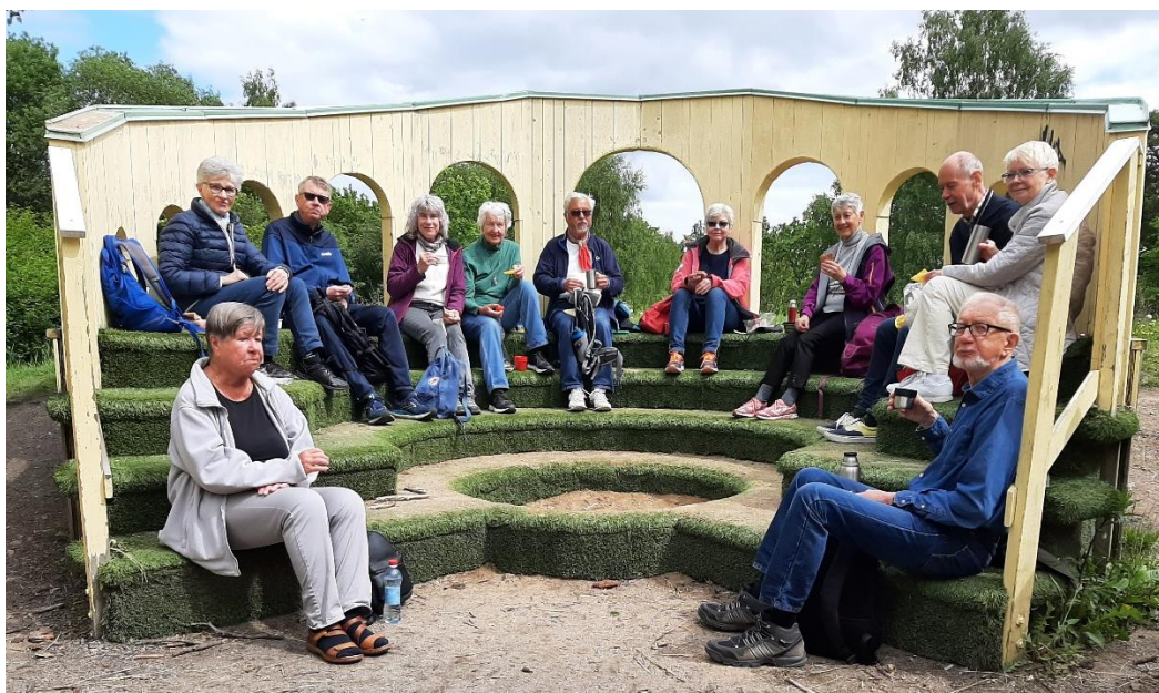
Den blev en alldeles utmärkt plats för våra matsäckar och ett gruppfoto.