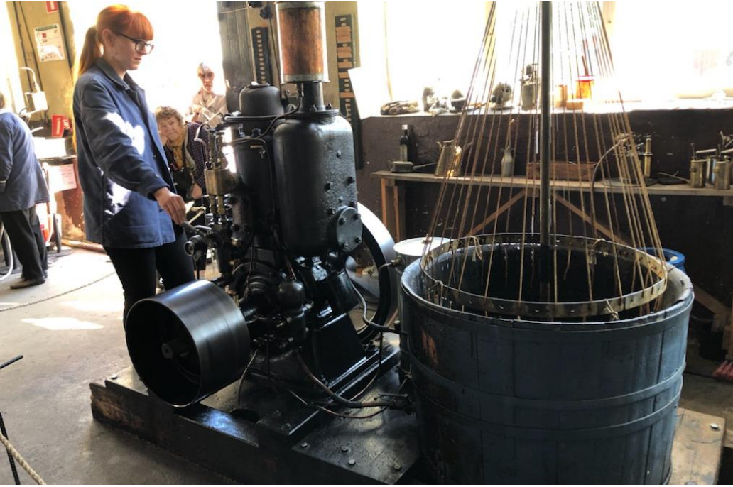
Guiden startade några tändkulemotorer med det välkända dunkandet.