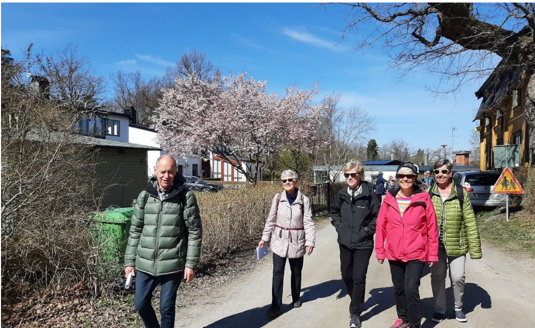
Vi gick tillbaka för att komma till vårt picknick-ställe.