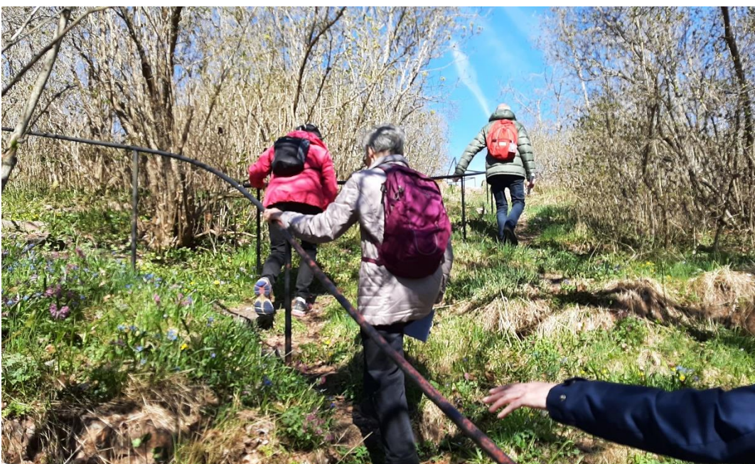
Vi gick Klockbergstigen upp till ...