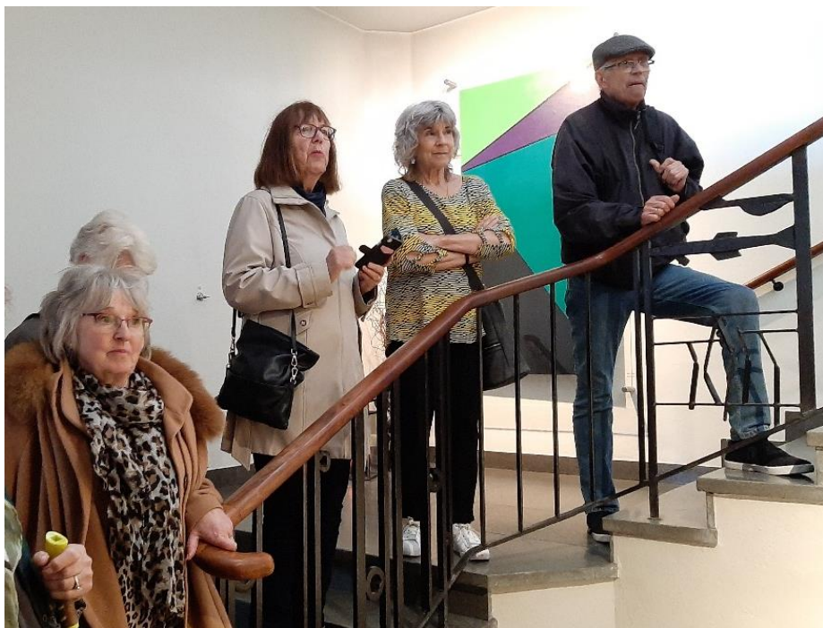
I trappan hänger målningen "Veda" av Olle Baertling.