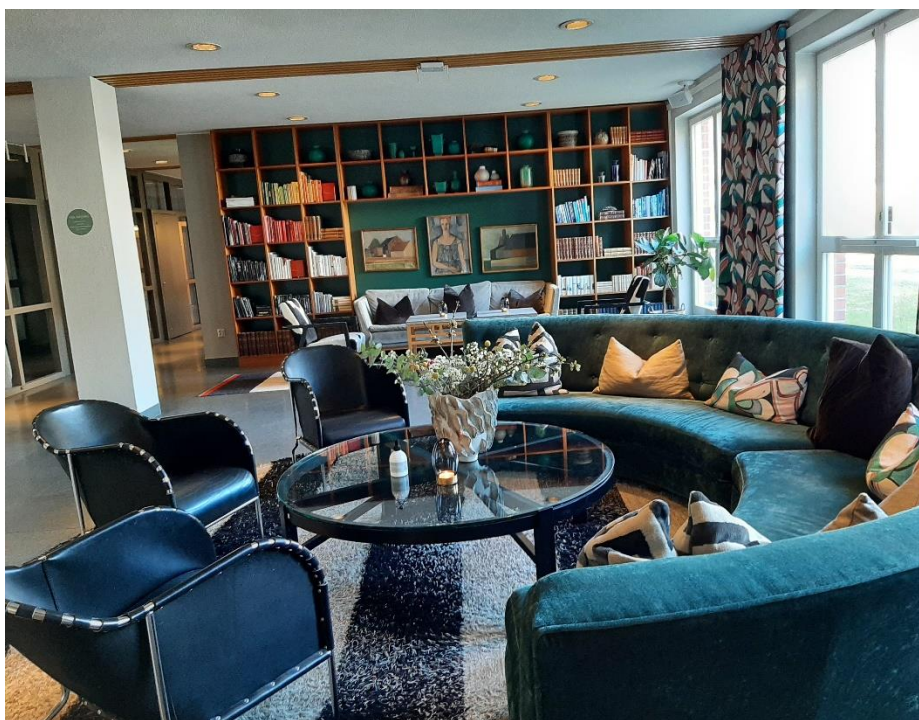
En trappa upp finns ett trevligt sällskapsutrymme med soffor och bokhyllor och konst förstås.