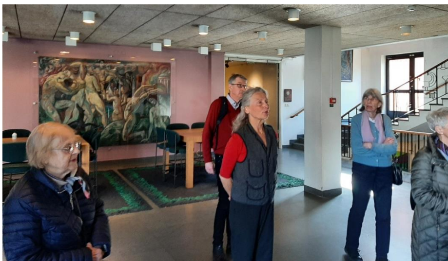
På motstående vägg hänger en av Axel Törneman många tavlor på Vår Gård.