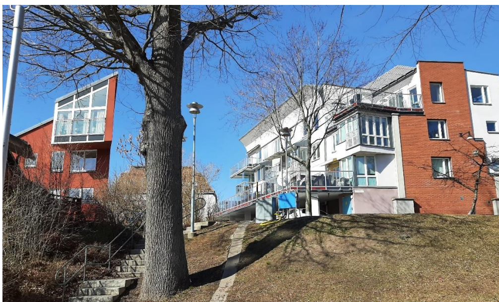
Ofta är det en fantasifull arkitektur i området.