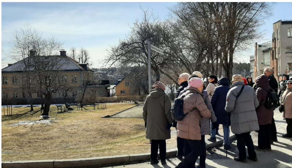
En öppen park med Järila Gård i fonden.