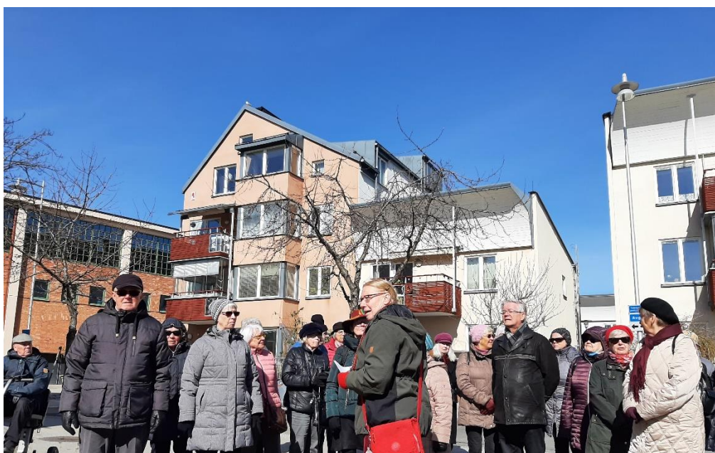
Runt omkring finns både gamla och nya byggnader.