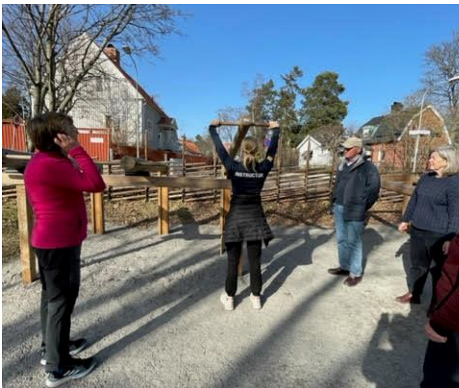
2. Sedan visade Tove olika sätt man kan använda 'maskinerna' enligt egen ork och förmåga.