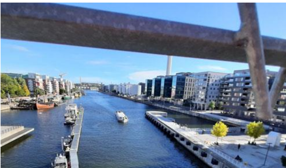
Från bron har man fin utsikt över Hammarby sjö och Södermalm till vänster och Södra Hammarbyhamnen till höger.