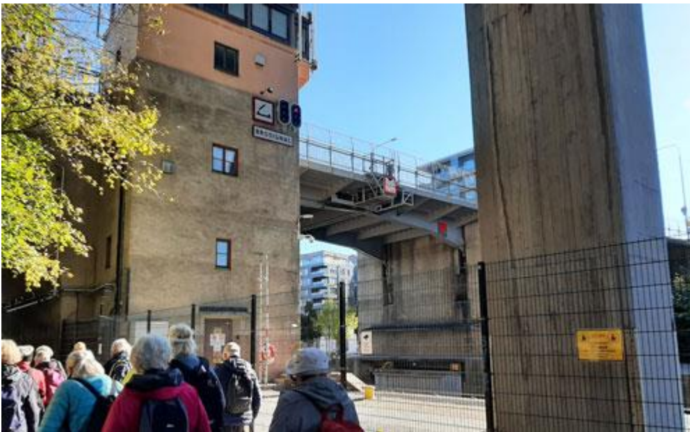
Här passerar vi Hammarbyslussen och den gamla klaffbron, Skansbron, från 1920-talet.