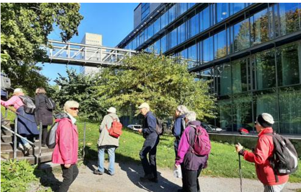
På andra sidan Skansbron finns en trappa upp till bron.